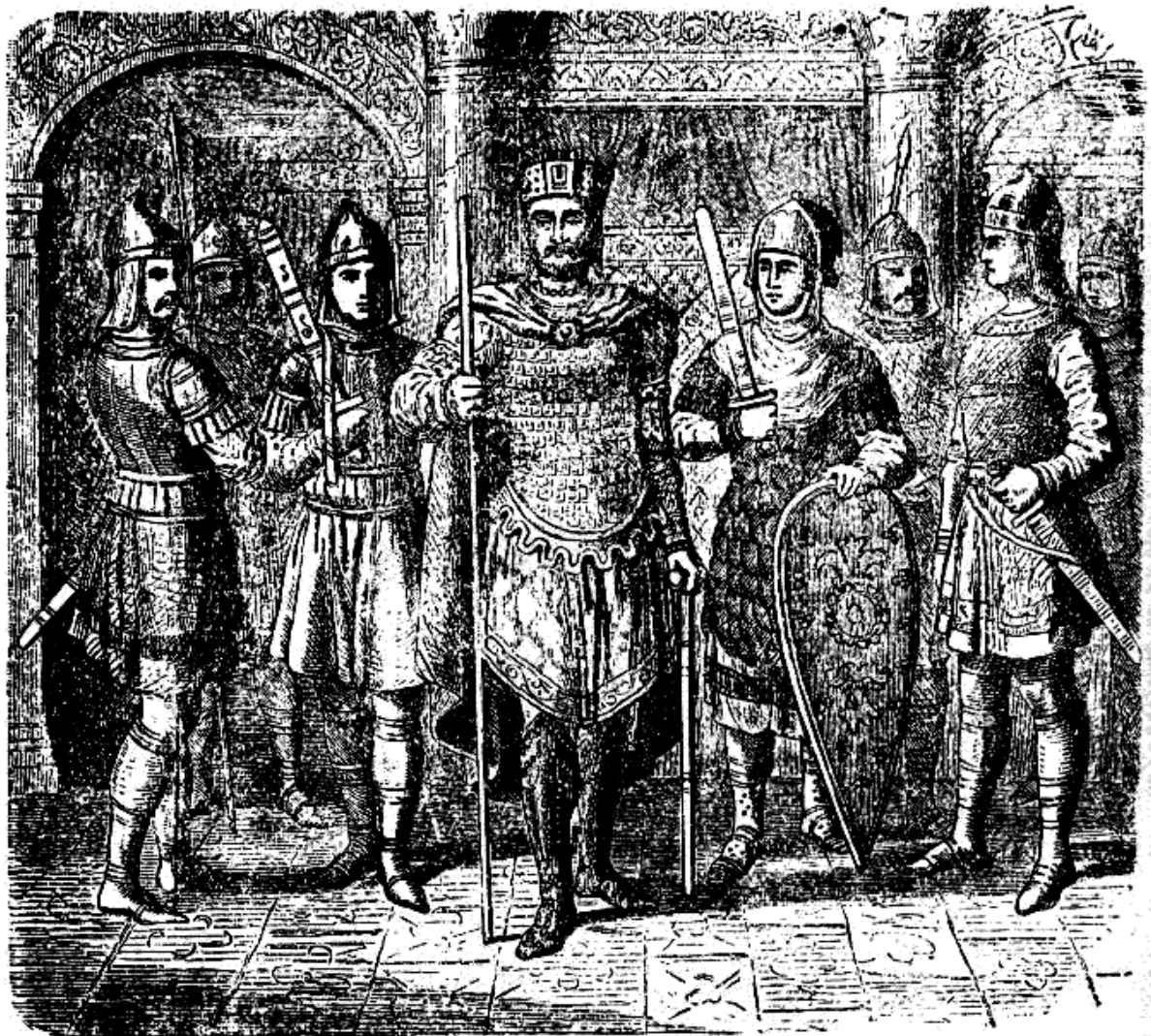
Византийски император със свитата си