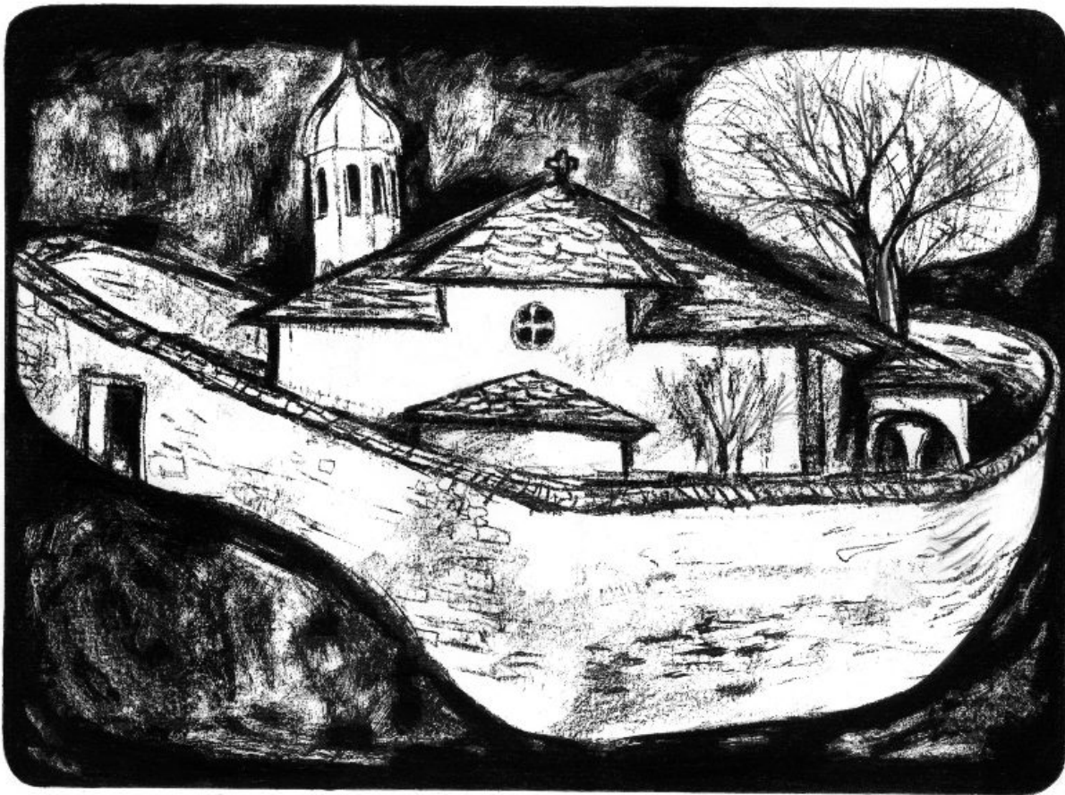
Пейзаж. Църквата в Широка лъка (литография), 1969 г.