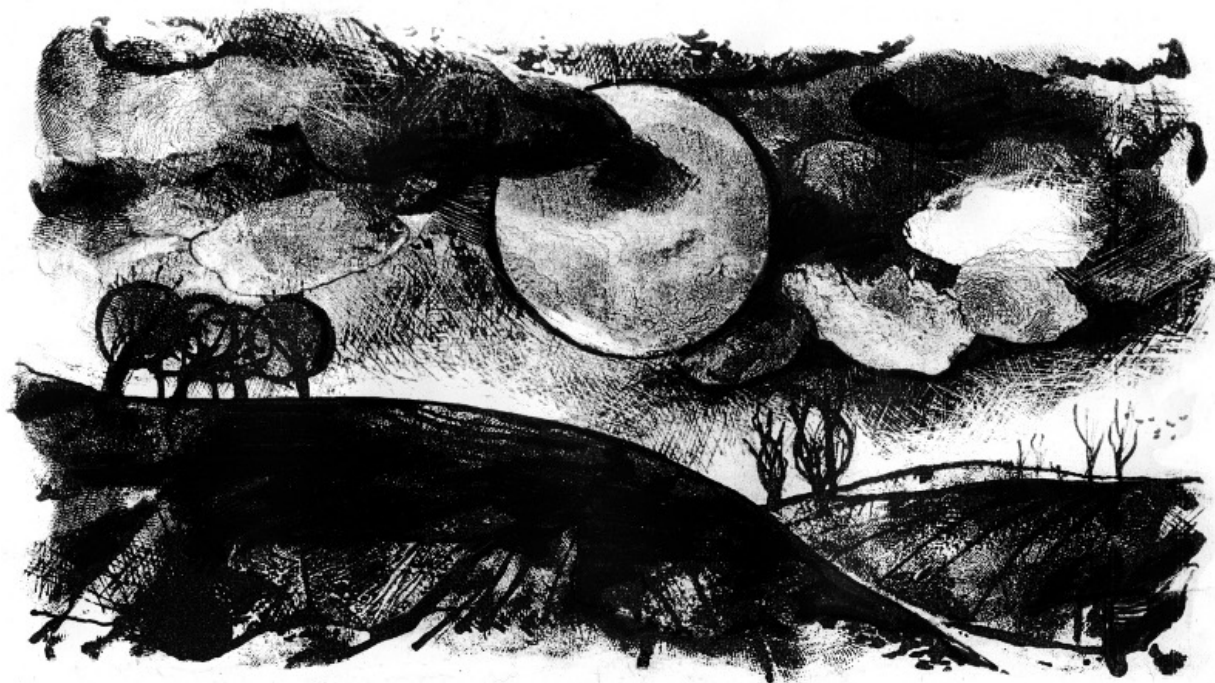
Пейзаж (литография), 1967 г.