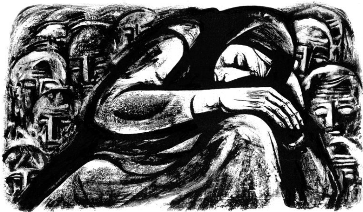
Пиета (литография), 1969 г.