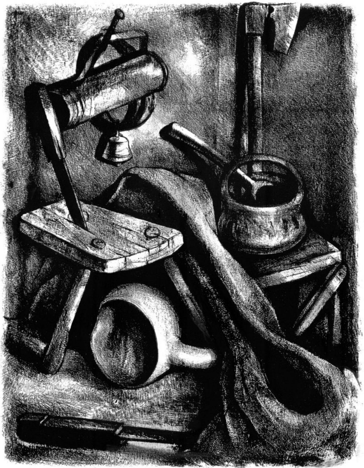
Овчарски натюрморт (литография), 1967 г.