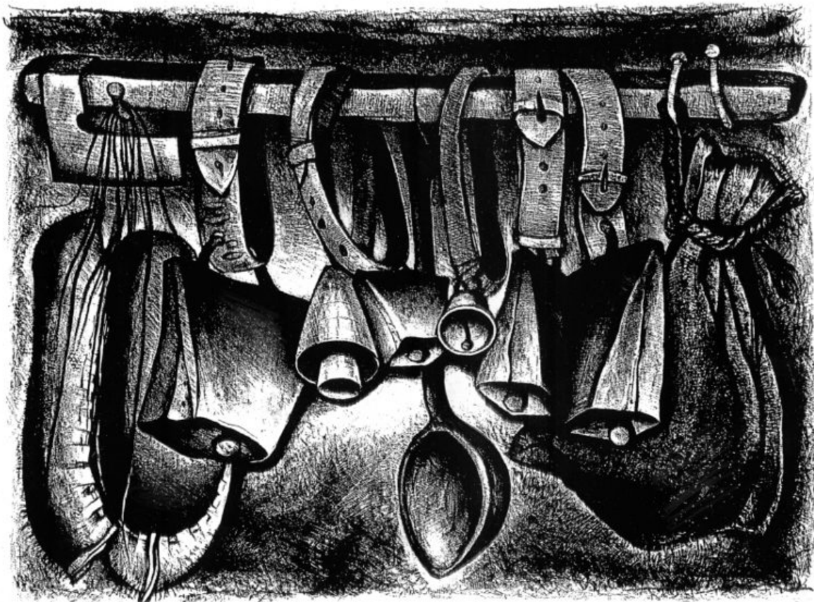
Чанове (литография), 1967 г.