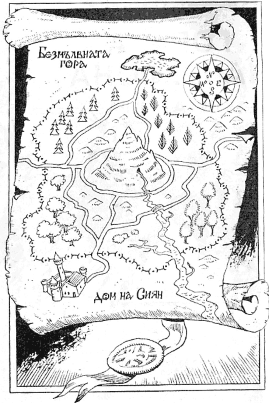
Карта на Дъбравата на покоя